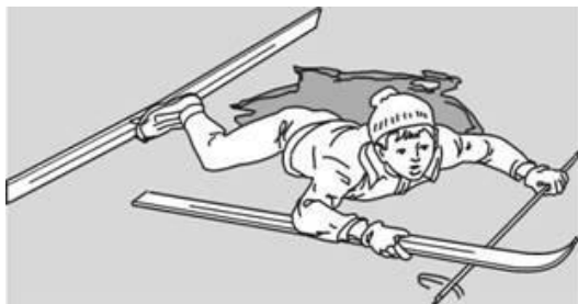
Попытки вылезти самому из полыньи с лыжами

Провалившемуся необходимо внушить, чтобы он широко раскинул руки на льду и ждал помощи, так как самостоятельная попытка вылезти из воды может привести к новому обламыванию кромки льда и очередному погружению пострадавшего под лед.