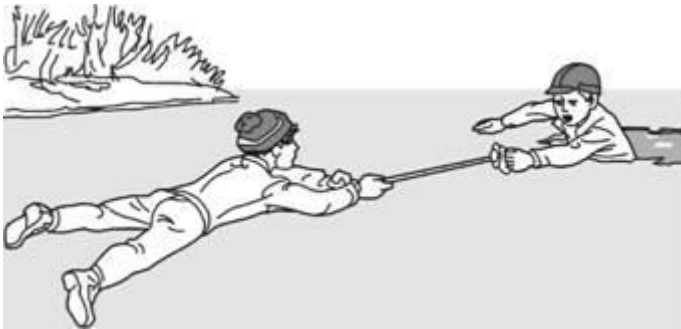
Помощь лыжной палкой

ложатся на лед и цепочкой продвигаются к пострадавшему, удерживая друг друга за ноги, а первый подает пострадавшему лыжные палки, шарф, одежду и т. д. Деревянные предметы (лестницы, жерди, доски и др.) необходимо толкать по льду осторожно, чтобы не ударить пострадавшего. Спасатель при этом должен обезопасить и себя. Продвигаясь к пострадавшему, следует лечь на доску, лыжи и другие предметы.