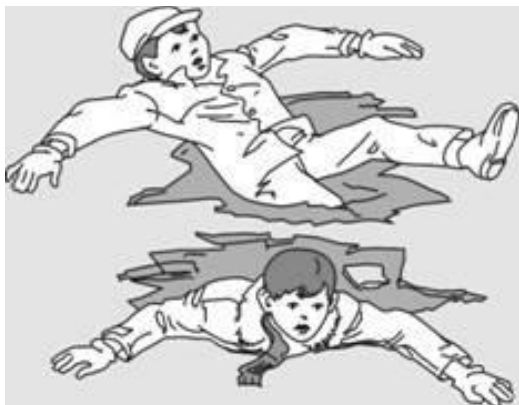
Попытки вылезти самому из полыньи грудью или спиной

Если вы провалились под лед, широко раскиньте руки, навалитесь грудью или спиной на лед и постарайтесь вылезти на него самостоятельно, зовите на помощь.